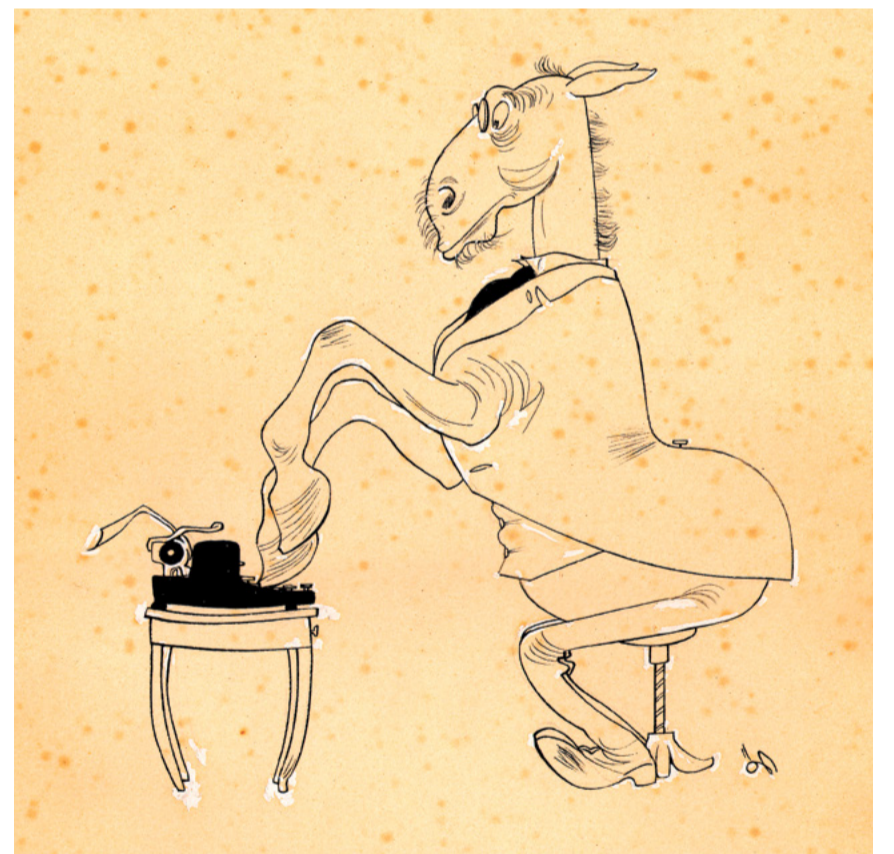
Der Amtsschimmel als Bürokrat trifft nicht immer die rechte Taste: träge Verdichtung im Bild.

Vernissage: 17. April, 19 Uhr, Museum Heiden