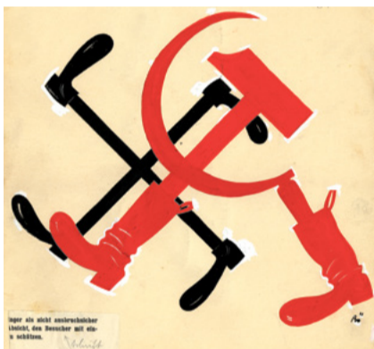
Stalins Kommunismus oder Hitlers Nationalsozialismus: Totalitarismen im Gleichschritt.